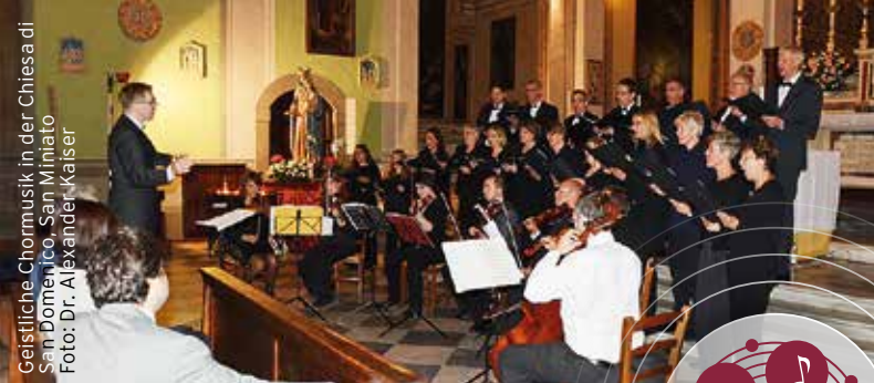
Geistliche Chormusik in der Chiesa di San Domenico, San Miniato