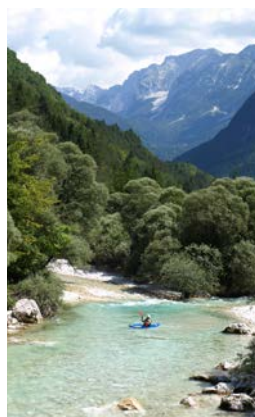
Triglav National Park

Wir machen uns auf den Weg nach Slowenien, in das wunderschöne Land mitten in Europa. Lassen wir uns einladen, denn: „Kommt, alles ist bereit!“ Wir werden sehen, wie schön das Land ist, welche einzigartigen Landschaften zu bewundern sind, welches Essen auch den Kindern gut schmeckt und welche Spiele sie uns zeigen wollen und noch vieles mehr. Lasst uns zu unserem Kinderweltgebetstag auch wieder gemeinsam singen: Gottes guter Segen verbindet unsre Welt. Auf allen unsern Wegen Gottes gute Hand uns hält. Wir freuen uns auf eine interessante Reise nach Slowenien.