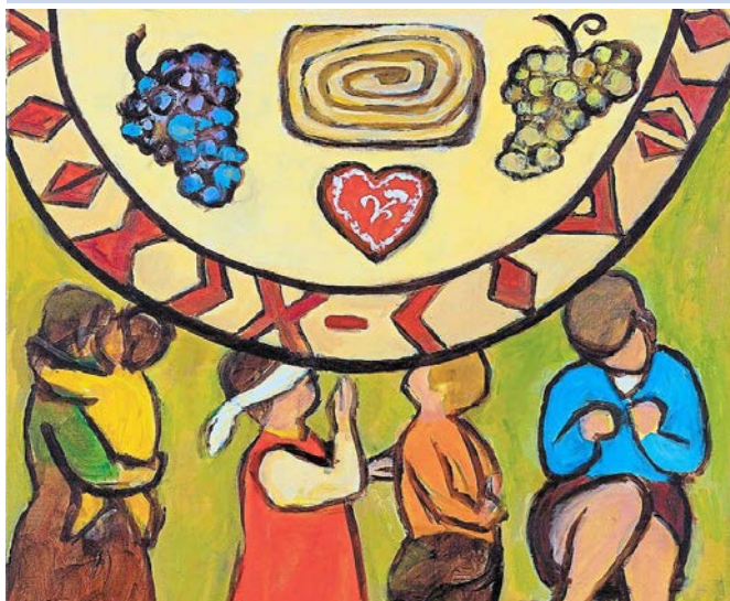
Titelbild des Weltgebetstags von Rezka Arnu (Ausschnitt)

Unter diesem Leitwort laden uns christliche Frauen aus Slowenien zum Weltgebetstag 2019 ein. Sie stellen uns ihr wunderschönes Land vor, das mitten in Europa liegt. Slowenien hat die Alpen mit hohen Bergen, klare Seen und tiefe Flüsse, grüne Wälder, Meer und Strand an der Adria-Küste. Verschiedene riesige Karst-Höhlen gehören zum Weltkulturerbe der UNESCO. Es war schon immer ein Land, durch das viele Völker zogen und ihre Kultur bereichert haben. Die Slowenen siedeln seit ca. 1.500 Jahren in diesem Gebiet, das schon viele Herrscher hatte. Lange Zeit gehörte es zu Österreich-Ungarn, ab 1918 war es ein Teil des jugoslawischen Königreiches, erst seit 1991 ist es ein eigener Staat. Das macht die Slowenen sehr stolz.